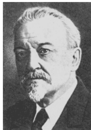
Дмитрий Николаевич Ушаков

6. Известный русский лингвист поражал современников благородством своей души, разнообразием интересов: он был великолепным педагогом, хорошим художником и настоящим ученым, много сделавшим для развития отечественного языкознания. Его ученики утверждали, что к нему «можно применить то, что говорят о немецком поэте Гете его биографы – самое лучшее из всего того, что он сделал, это его собственная жизнь». Благодаря этому ученому, еще в 30-х годах XX века учащиеся школ получили «Орфографический словарь», но известнее в нашей стране другой его словарь, ныне несколько устаревший, но наиболее полно отражающий изменения в русском языке после Октябрьской революции 1917 года, в 20–30-х годах XX века. О каком ученом и каком словаре идет речь?